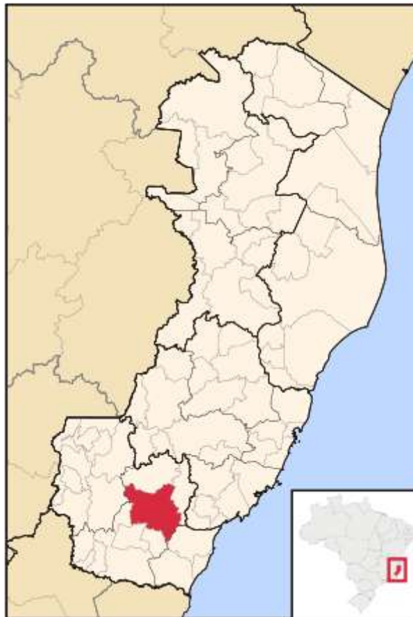
Figura 01: Localização Geográfica de Cachoeiro de Itapemirim (ES).

A criação da Sociedade América de Educação Ltda., mantenedora da Faculdade América, se concretizou quando foi assinado o Contrato de Constituição da empresa no dia 28 de julho de 2010. Inscrita no CNPJ 12.408.344/0001-13, com limite territorial de atuação circunscrito ao município de Cachoeiro de Itapemirim, Espírito Santo (FIGURA 1). É uma faculdade isolada, atuando no ensino superior, possuindo como missão “ensinar com excelência, formando profissionais comprometidos com a ética, competentes e conscientes do seu papel social, visando contribuir para o desenvolvimento do país”. A Sociedade América de Educação Ltda. nasceu com a experiência acumulada de seus gestores no âmbito da educação, haja vista que seus mantenedores possuem em média mais de 20 anos de atuação no ensino superior, tendo como princípios norteadores de suas ações o compromisso em desenvolver uma educação cidadã e comprometida com a formação do ser humano.