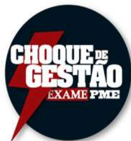
Figura 02: Choque de Gestão Revista Exame

Outros pontos a serem salientados, é que no ano de 2010, o UNIFACIG foi o vencedor do Prêmio Nacional de Gestão Educacional, na categoria Gestão Administrativa Financeira, por meio da concessão realizada pela Confederação Nacional dos Estabelecimentos de Ensino – CONFENEN – em parceria com a Associação Brasileira de Mantenedoras de Ensino Superior – ABMES – e com a Associação Nacional dos Centros Universitários – ANACEU. O prêmio visa estimular a divulgação e a disseminação de boas práticas relacionadas à gestão educacional. A relevância do prêmio pode ser constatada pelas instituições vencedoras. Na categoria Responsabilidade Social, a agraciada foi a Fundação Torino, empresa vinculada à FIAT Automóveis localizada em Belo Horizonte / MG. Participou, também, do concurso Choque de Gestão promovido pela Revista Exame PME, da Editora Abril, onde foi finalista após concorrer com cerca de 200 empresas de todo o país, dos mais diversos setores. A Instituição foi classificada entre as quatro finalistas, tendo sido apresentada na edição da revista do mês de setembro de 2010. Nesse mesmo ano, o Curso Superior de Tecnologia em Marketing da instituição foi considerado, mais uma vez, como o melhor de todo o Estado de Minas Gerais, segundo o Ministério da Educação, reforçando a excelência do ensino fornecido pelo Centro Superior de Estudos de Manhuaçu Ltda.